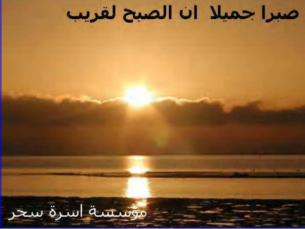
مؤسسة اسرة سحر