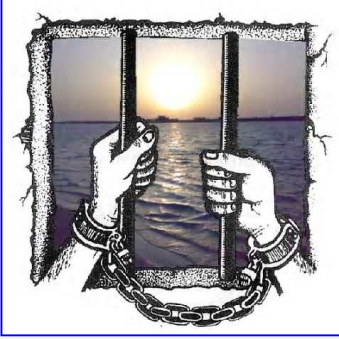
مؤسسة اسرة سحر